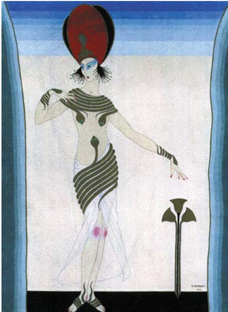
Рисунок Н.Рамбовой «Египтянка», 1921 Музей Н.Рериха. Нью-Йорк