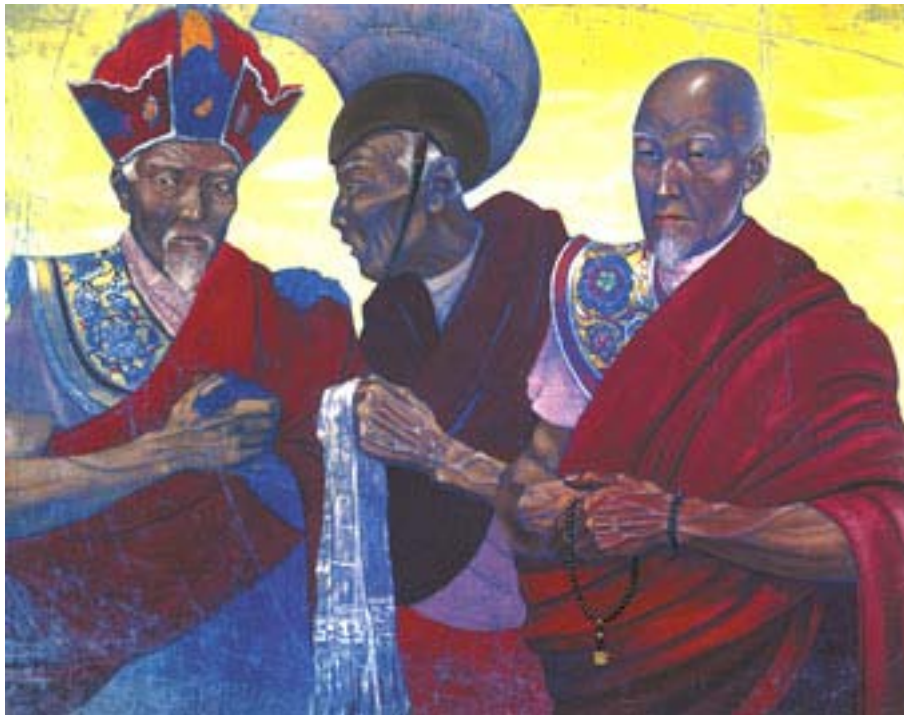
С.Н. Рерих. Три ламы. 1924