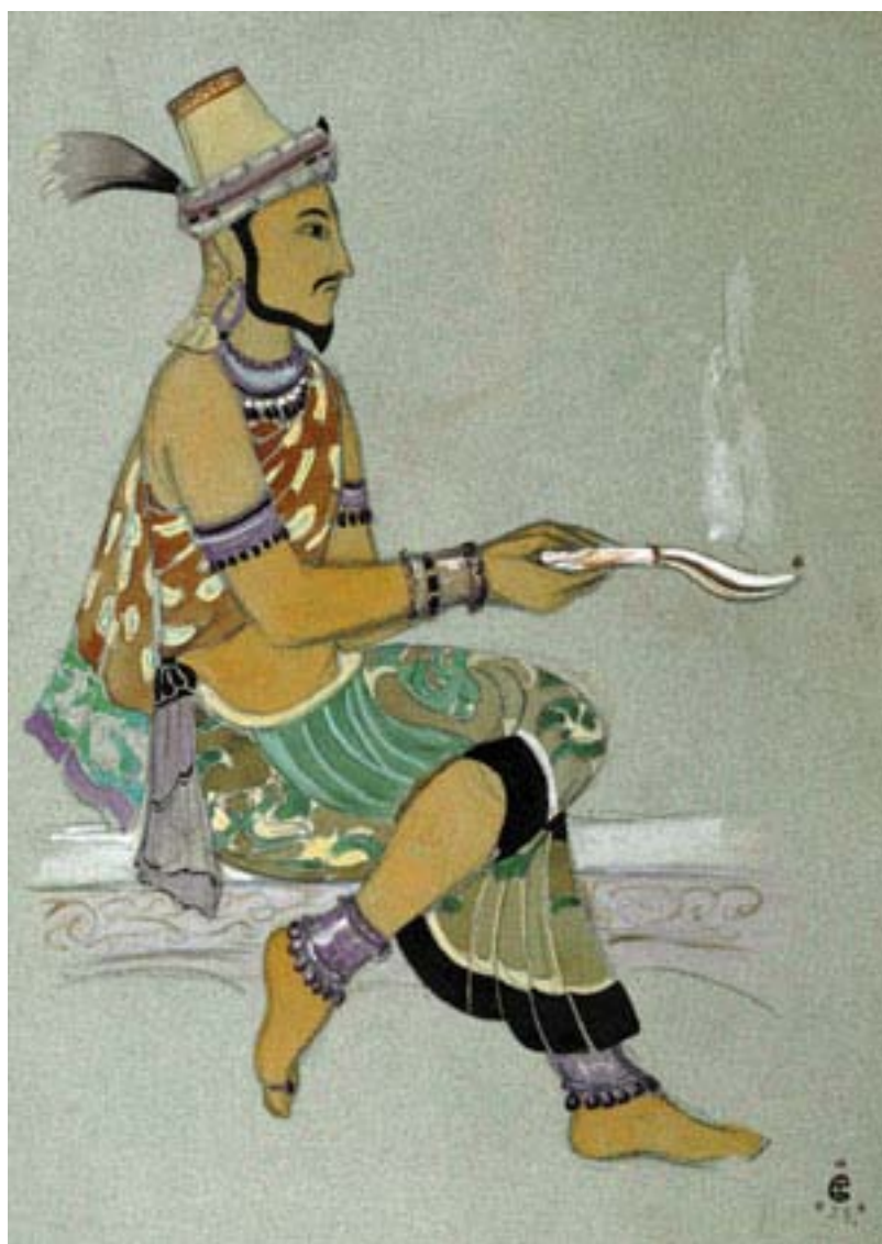
С.Н. Рерих. Эскиз костюма. 1924 Музей Н.Рериха. Нью-Йорк