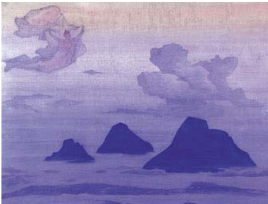
Н.К. Рерих. Выше, чем горы. 1924

Сегодня стюард говорил, что декабрь и январь — два самых холодных месяца для Красного моря. Вот уже две недели, как мы в пути. Так 14 дней и вычеркни. Как же? Как вы там живете? А мы все о вас думаем!