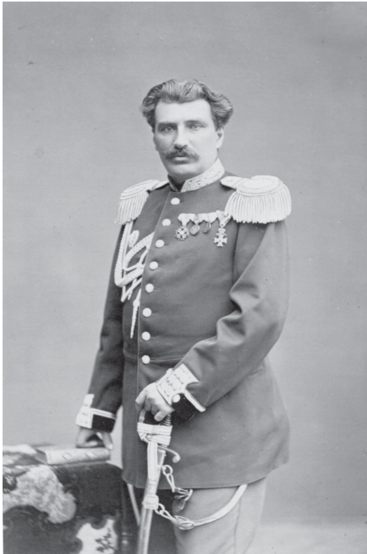
Н.М.Пржевальский